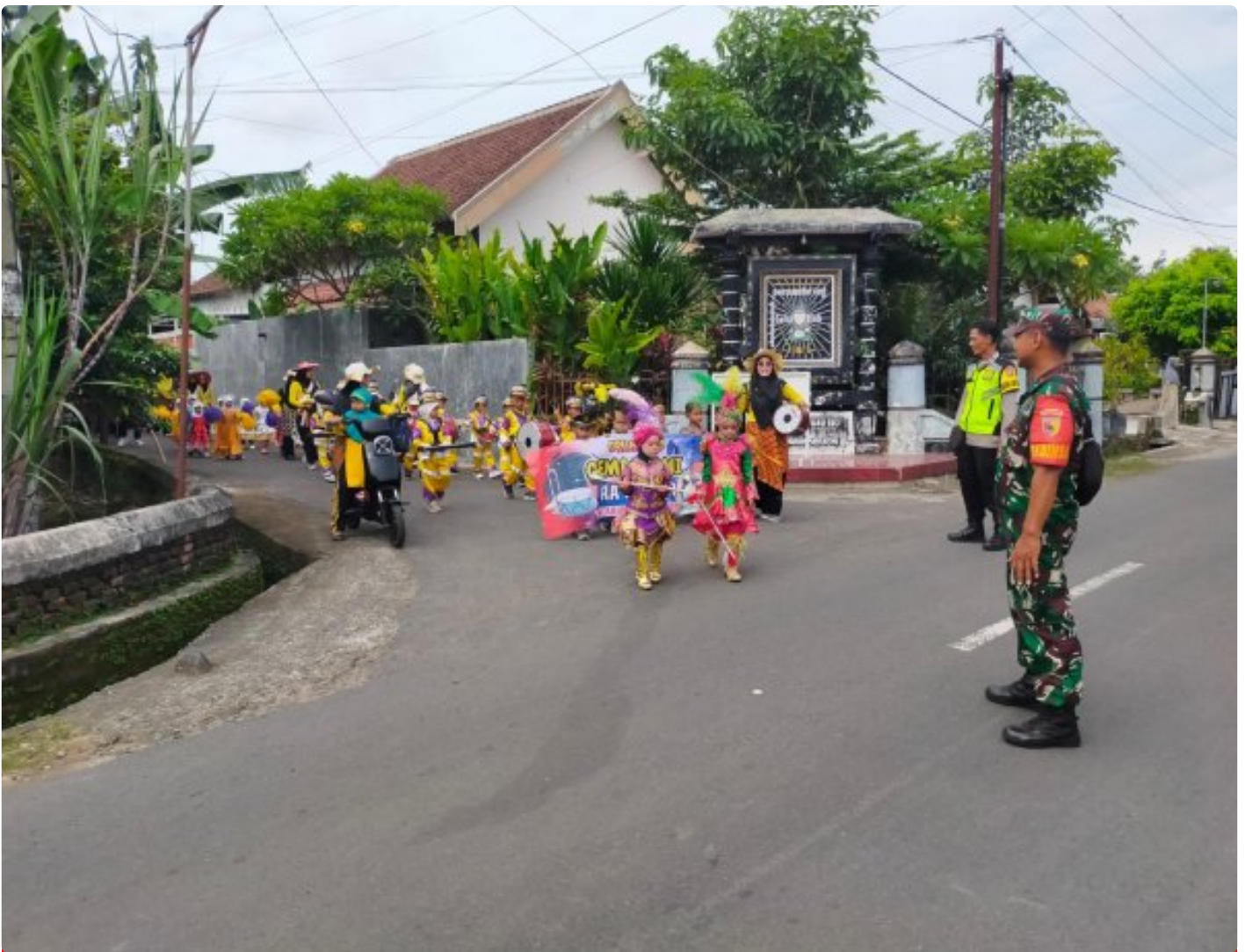
Gebyar Rojabiyah RA dan MI, Babinsa bersama Bhabinkamtibmas Amankan Jalannya Kegiatan Parade Drum Band